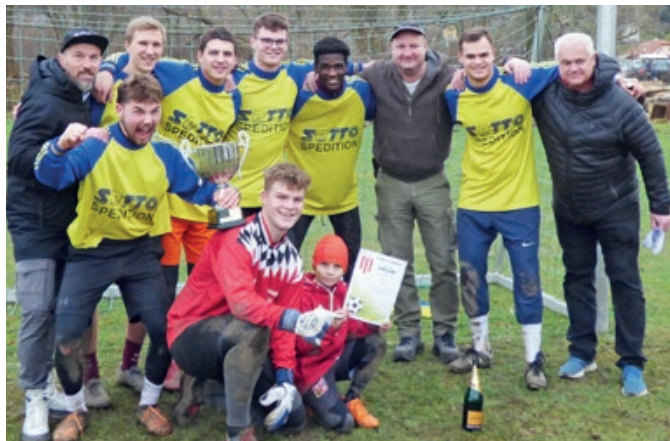
Vítězný tým Parcelony, která po 13 letech vyhrála tradiční Novoroční turnaj lipeneckých čtvrtí.

Vyběhnout na zelený trávník se však nic nevyrovná. Hřiště je nyní navíc nově chráněno před nájezdy divokých prasat, protože se za finanční injek-