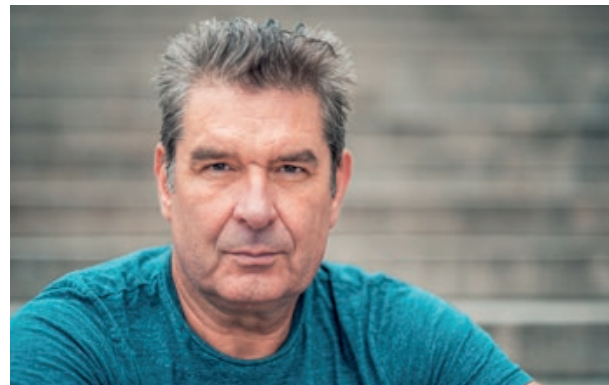
close up